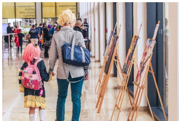
Cosplay & Kunst