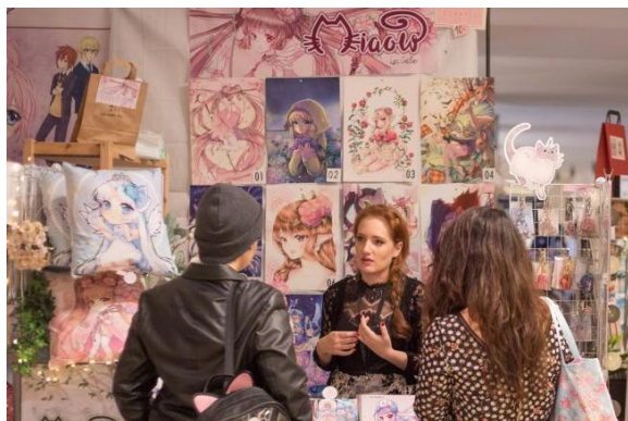
Künstler und Kulturschaffende