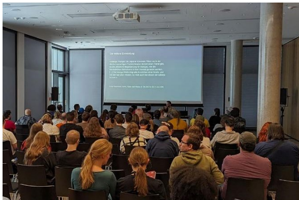
Vortrag zur Japanforschung